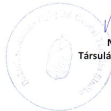
Nagy Lajos Társulási Tanács Elnöke